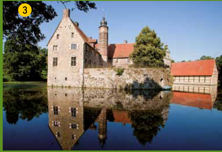
3 Burg Vischering – eine der schönsten Wasserburgen Deutschlands. Erstmals 1271 erwähnte Ringmantelburg mit Vorburg und weitläufigem Gräftensystem. Heute Münsterlandmuseum, mit wechselnden Ausstellungen in der Remise und Café in der Vorburg.