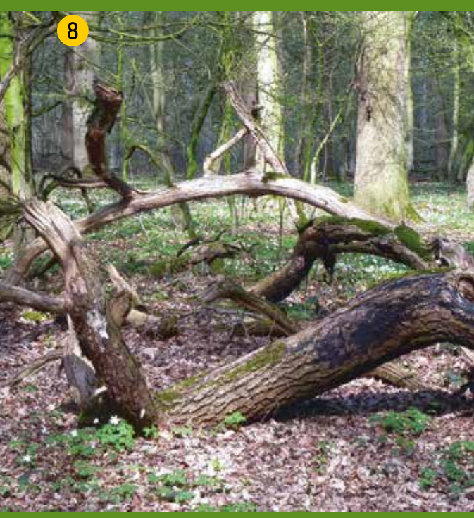
8 Natürlicher Alt- und Totholzreichtum ist charakteristisch für forstlich nicht genutzte Wälder. Damit kehrt der Artenreichtum zurück, der dem Wirtschaftswald fehlt.