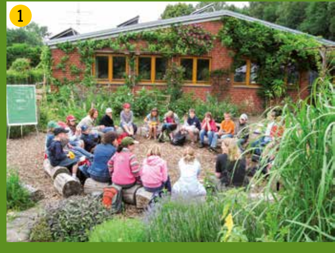
1 Biologisches Zentrum Kreis Coesfeld steht seit 25 Jahren für Umweltbildung in der Region. Besucher sind herzlich eingeladen! Genießen Sie das Gelände – www.biologisches-zentrum.de .