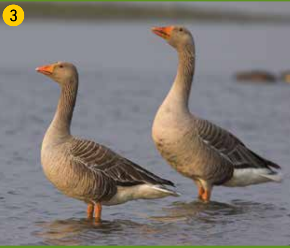
3 Graugänse brüten an den Gräften der Burg Vischering. In unserer Gegend ursprünglich für jagdliche Zwecke ausgewildert, haben sie sich weit verbreitet. Sie sind die Stammform der Hausgans.