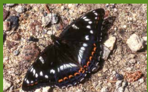
Kleiner Eisvogel – ein wunderschöner Falter der feuchten Laubwälder. Seine Raupen leben am Geißblatt.