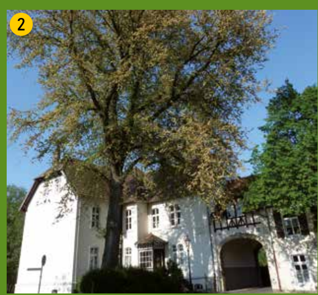
2 Die stattliche Ulme am Torhaus zur Renaissanceburg Lüdinghausen.

Den GPS-Track finden Sie auf den Internetseiten der verschiedenen Partner des Projektes.