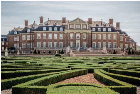
Schloss Nordkirchen