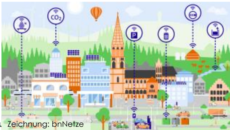
Vorstellung der Bewerber Zeichnung: bnNetze