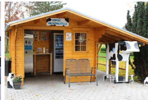
Milchtankstelle am Hof Lenfers