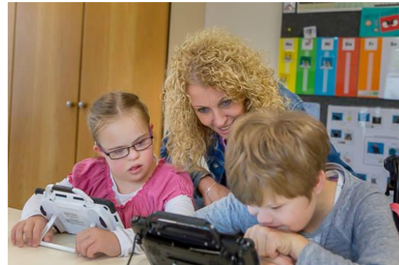
Barrierefreies Wohnen in der Kinderheilstätte Nordkirchen