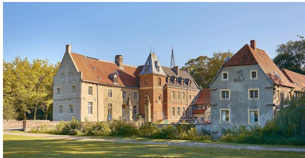
Schloss Senden