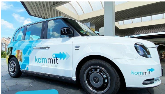
Kommit-Shuttles in Senden – Projekt des BÜLaMo