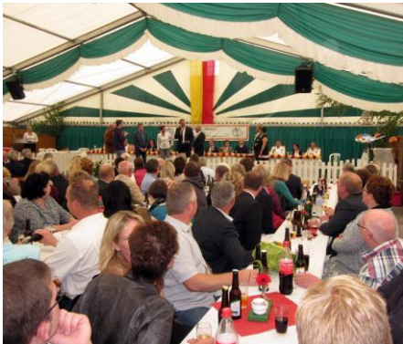
Schützenfest in Lüdinghausen