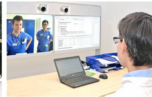
Telemedizin am UKM