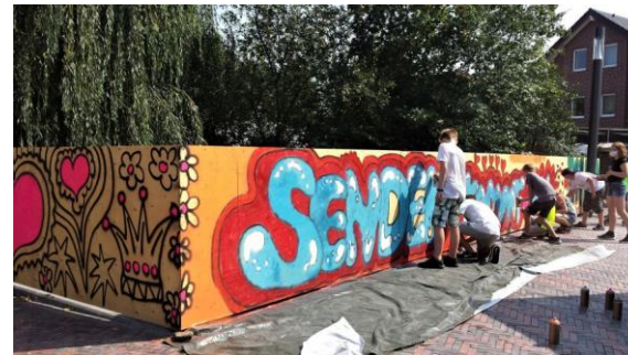
Jugendkunstschule in Senden