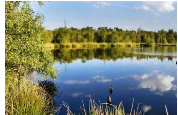
Venner Moor