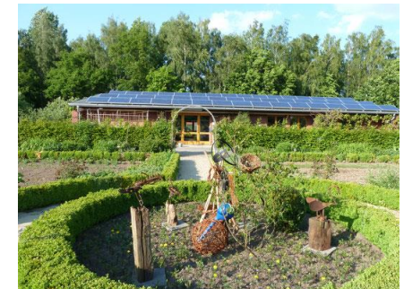
Biologisches Zentrum in Lüdinghausen