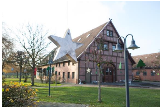
Wohngruppen auf dem Bauernhof Ascheberg