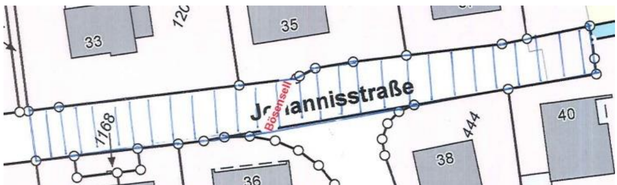
Übersichtsplan Nr. 3

Gem. § 6 Straßen- und Wegegesetz des Landes Nordrhein-Westfalen (StrWG NRW) in der derzeit gültigen Fassung ergeht folgende